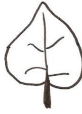
cordée (forme de cœur)